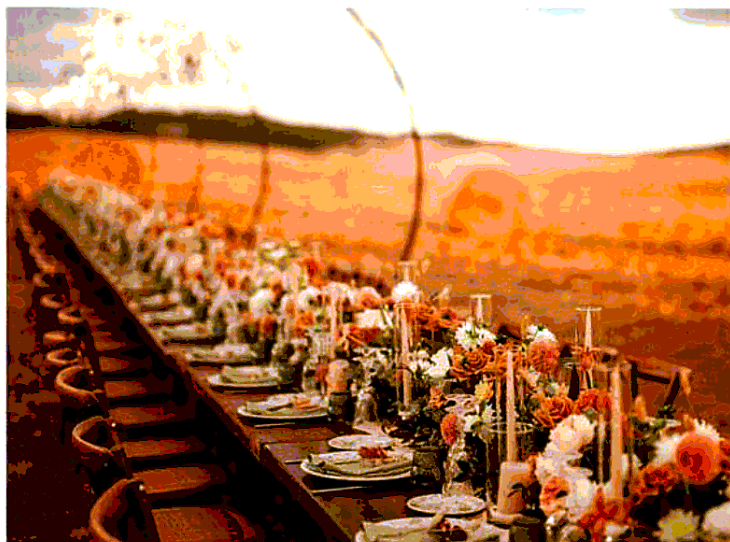
Tavolata campagnola alla Locanda in Tuscany in Val d'Orcia.

Il matrimonio a Portofino è da sempre nella top ten. Sopra una fettuccia di costa che guarda l'intero golfo del Tigullio si nasconde l'ex convento benedettino quattrocentesco che ha tutto per celebrare un evento memorabile. Dovunque si guardi è un set fotografico, la tavola imperiale è allestita su una terrazza fronte mare, nei giardini all'italiana si svolge il taglio della torta e nell'agrumeto la festa. Naturalmente in questa abbazia-resort-parco, che fa parte dei Grandi Giardini